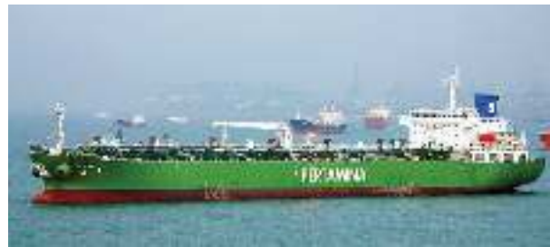
Gambar Kapal MT. Sei Pakning

MT. Sei Pakning memiliki nama panggilan ( Call Sign ), PODV (Papa Oscar Delta Viktor) , memiliki Deadweight (DWT) 29.756 Ton, panjang kapal 180,00 meter, lebar 30,49 meter. MT. Sei Pakning di buat di China dan Louncing pada 15 Oktober 2011. Class yang di miliki kapal adalah BKI dan DNV , kapal beroperasi di Indonesia, discarging maupun loading dengan pelabuhan yang berbeda beda sesuai dengan shipping order yang di kirim perusahaan ke email kapal. Crew kapal berjumlah 29 (dua puluh sembilan) crew termasuk nakhoda, semua crew kapal berkebangsaan indonesia.