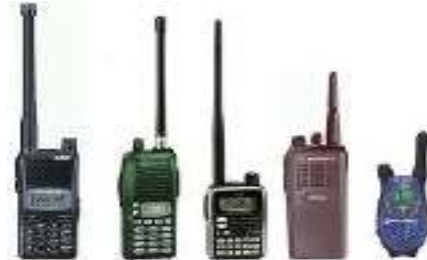
Gambar HT ( handy talky )

(HT) ada yang mengalami kerusakan dapat segera diganti dengan handy talky (HT) baru, sehingga pelaksanaan dinas jaga tetap berjalan dengan optimal.