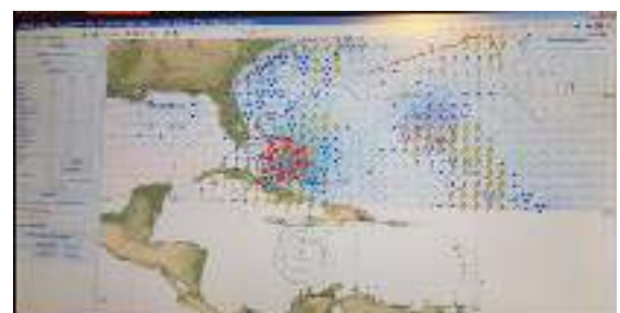
Gambar 4. Pergerakan angin Hurricane Matthew tanggal 06 Oktober 2016

Dalam metode head and bow seas terdapat resiko terjadinya racing propeller berdasar pada trim and stability tabel of MV. Bernhard Schulte serta data stabilitas didapat perhitungan mengenai propeller immersion .