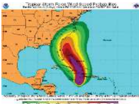
Gambar 2. Daerah terdampak angin Hurricane Matthew

a. Berdasar hasil penelitian dengan Master mengenai cara berolah gerak saat menghadapi Hurricane Matthew , peneliti mendapat data sebagai berikut: