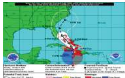
Gambar 1. Navigable semi-circle dan dangerous semi-circle

Pada gambar berikut terlihat terdapat area biru dan area merah. Area biru merupakan navigable semi-circle area dari Hurricane Matthew dan area merah merupakan dangerous semi-circle area dari Hurricane Matthew.